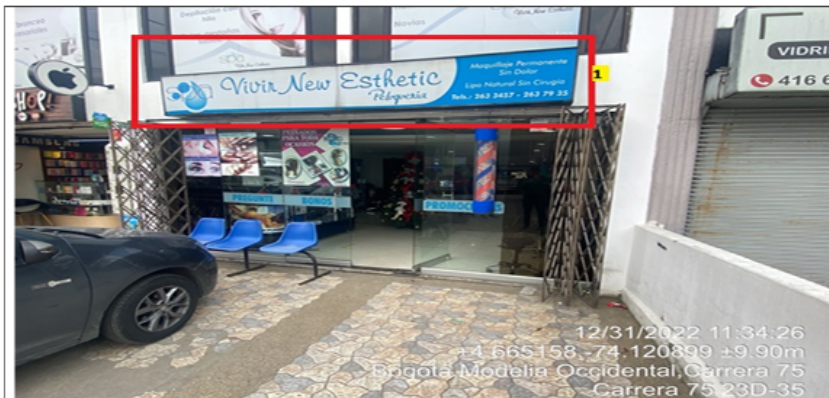
En la cual se evidencia un (1) elemento tipo aviso en fachada, ubicado en antepecho de segundo piso perteneciente al establecimiento comercial SPA VIVIR NEW ESTHETIC PELUQUERÍA, el cual al momento de la visita se encontraba instalado sin el registro ante la SDA.