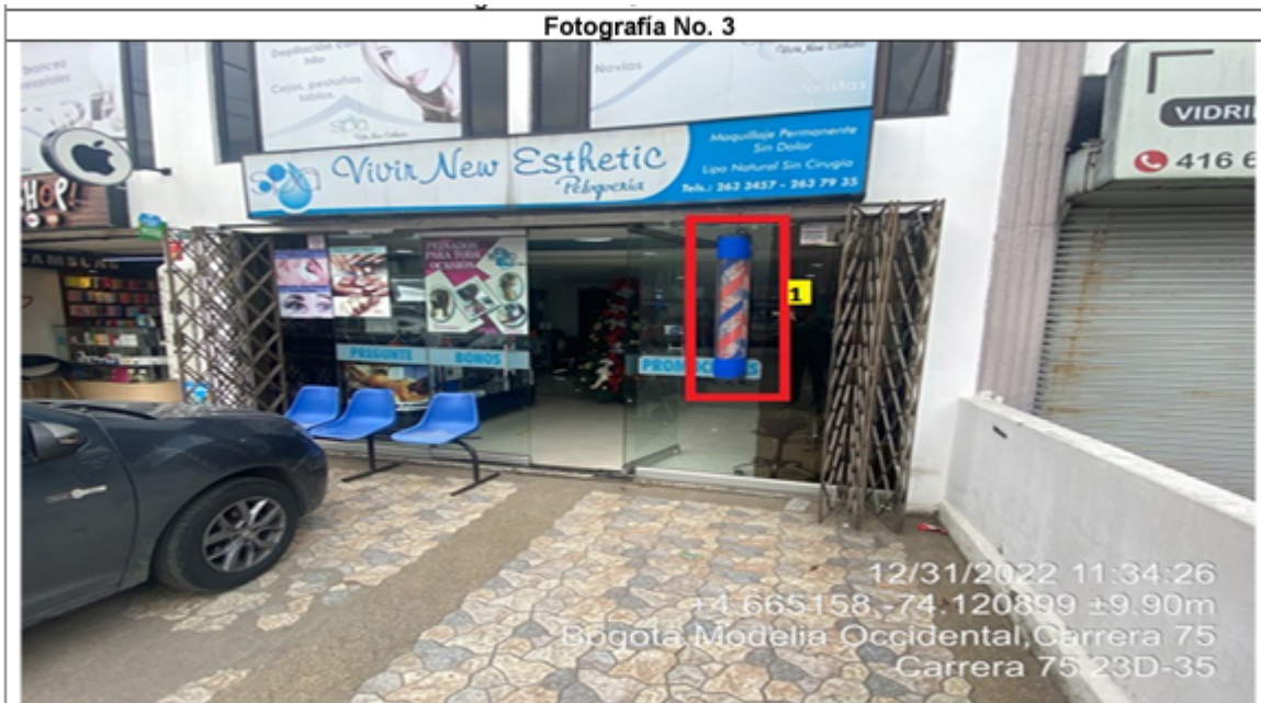
En la cual se evidencia un (1) elemento no autorizado perteneciente al establecimiento comercial SPA VIVIR NEW ESTHETIC PELUQUERÍA, el cual se encuentra ubicado en las ventanas de la edificación y es adicional al único elemento permitido por fachada de establecimiento comercial.